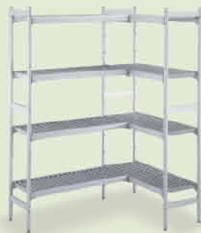
Elementi di stoccaggio

Il Sistema Preparazione Statica è l'ideale per ogni professionista del settore, perché soddisfa in maniera assolutamente perfetta anche le esigenze più complesse di preparazione, lavaggio e stoccaggio degli alimenti. Oltre a distinguersi per un design innovativo ed ergonomico, questa gamma di prodotti è curata in ogni minimo dettaglio per risultare semplice all'uso e facile da pulire. È, infatti, realizzata completamente in acciaio inox e provvista di plus tecnici di notevole rilevanza, quali gli angoli raggiati, le pieghe salvamani, robusti piani di lavoro da 50 mm, piedini regolabili in altezza, facilità di accesso ai vani. Tutti gli elementi della linea naturalmente rispettano le più restrittive normative nazionali ed internazionali sull'igiene e la sicurezza e sono marchiati CE.