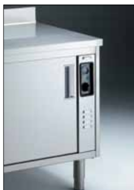
Dettaglio della struttura