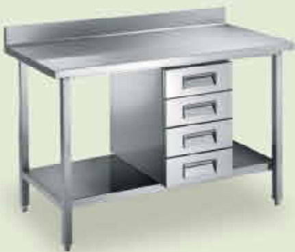
Tavoli su gambe