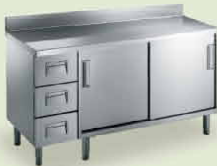
Tavoli armadi neutri e caldi