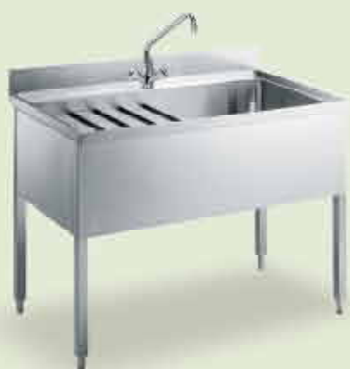
Lavatoi su gambe