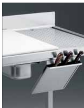
Cestello filtro tavolo pesce