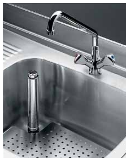
Vasca con angoli arrotondati e troppopieno

Modello lavamani a pavimento con sanitizzatore coltelli