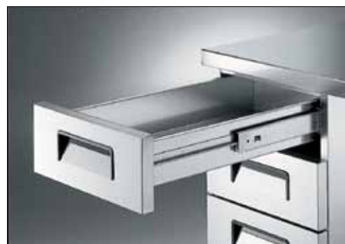
Ampio cassetto con guide